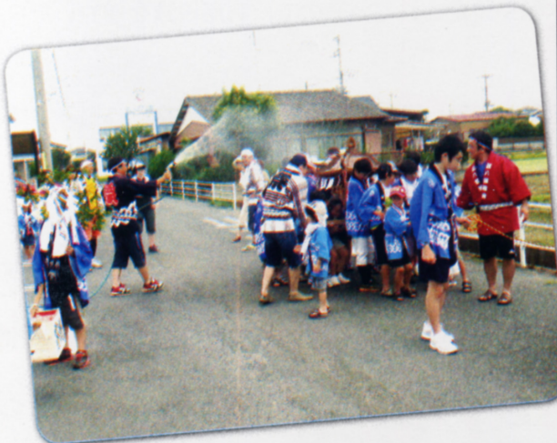
子供みこしの風景