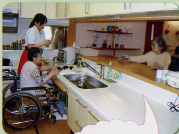
陽だまりでの調理の様子