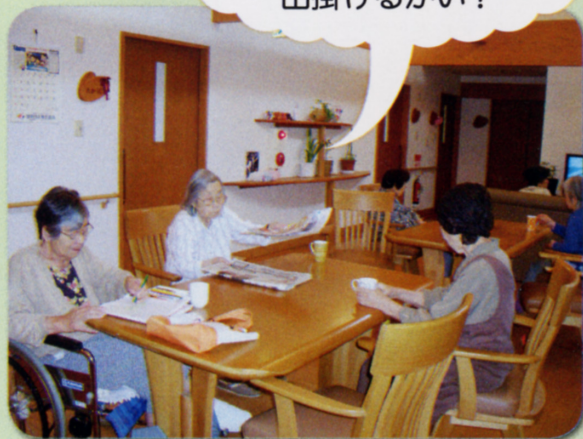
陽だまりでの日常の様子