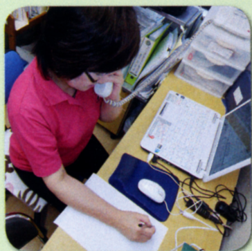
相談を受けている様子

このような相談をもとにしてより充実した支援を行うために、相談支援事業は平成24年度から下記のように3つの体制に変わりました。